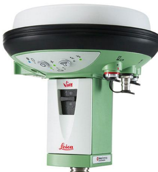
Рисунок 2 - Внешний вид аппаратуры геодезической спутниковой Leica GS15

Пломбирование крепёжных винтов корпуса приемника Leica GS10, Leica GS15 не производится, все внутренние крепежные винты залиты пломбирующим лаком.